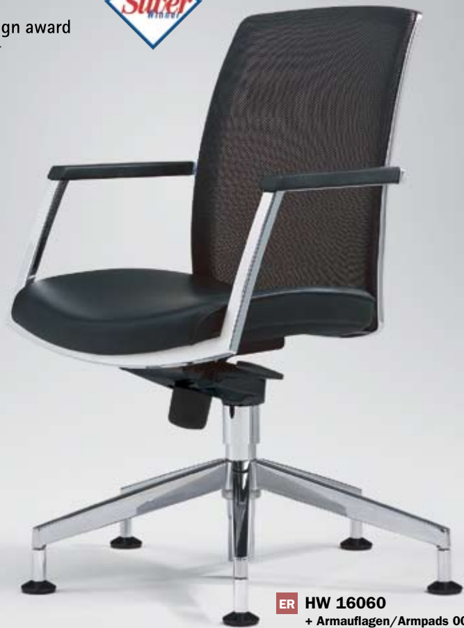
ER HW 16060 + Armauflagen/Armpads 002 Netz-Rückenlehne/Mesh backrest