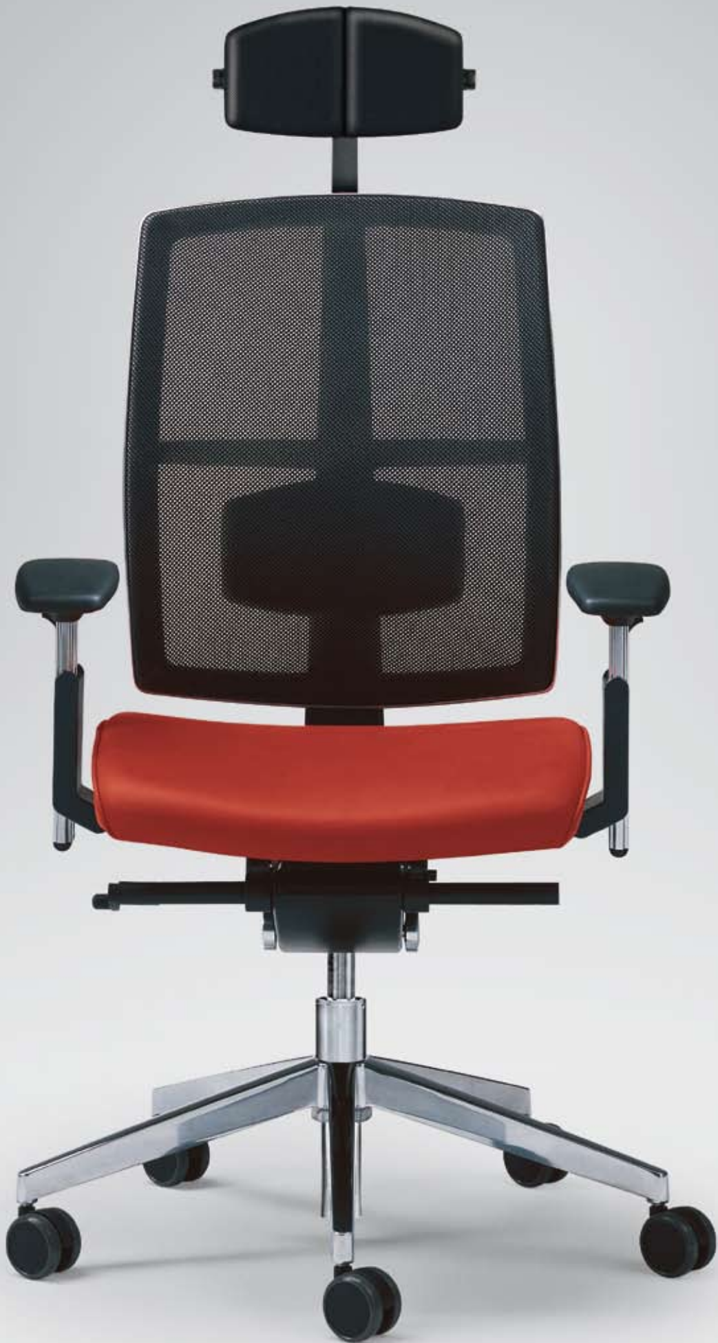
ES HW 16135 + Armlehnen/Armrests 315