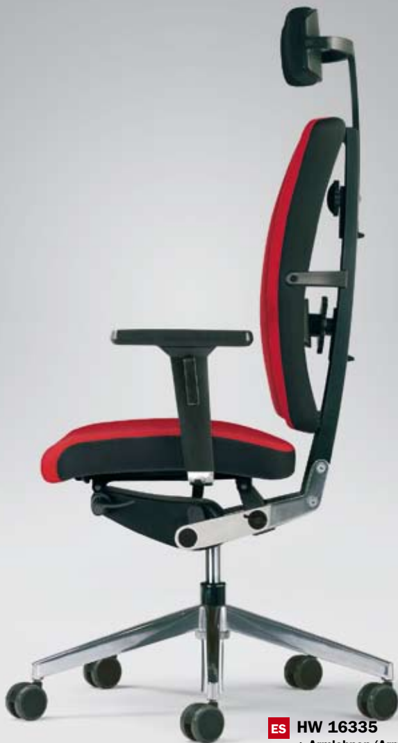
ES HW 16335 + Armlehnen/Armrests 397