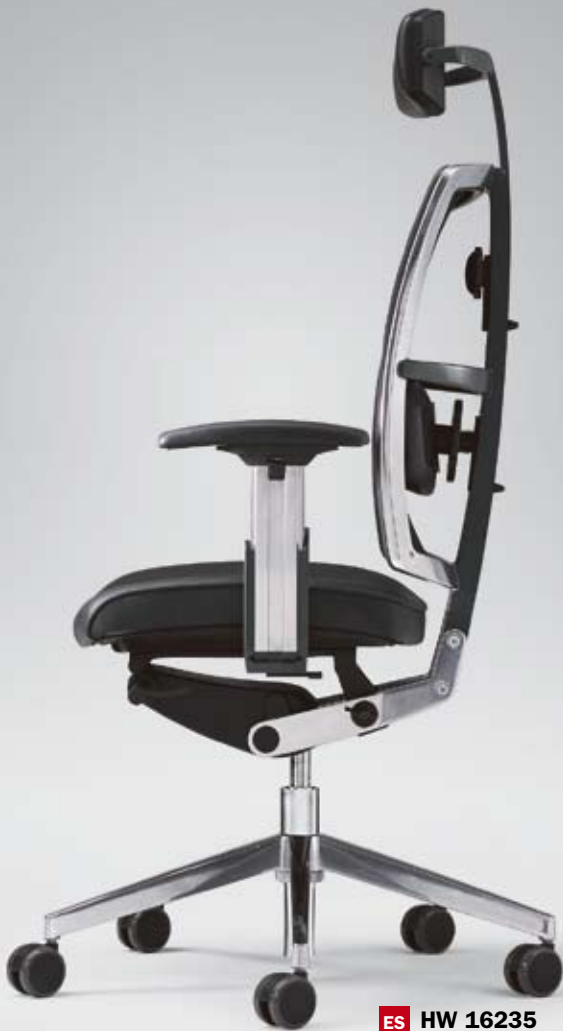
ES HW 16235 + Armlehnen/Armrests 312