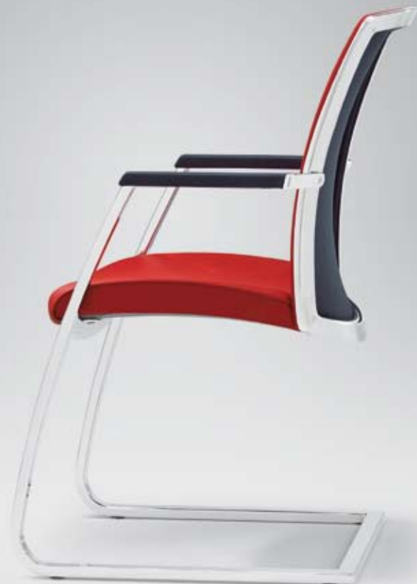
HW 16030 + Armauflagen/Armpads 002 Netz-Rückenlehne mit Polsterauflage/ Mesh backrest with pad upholstered