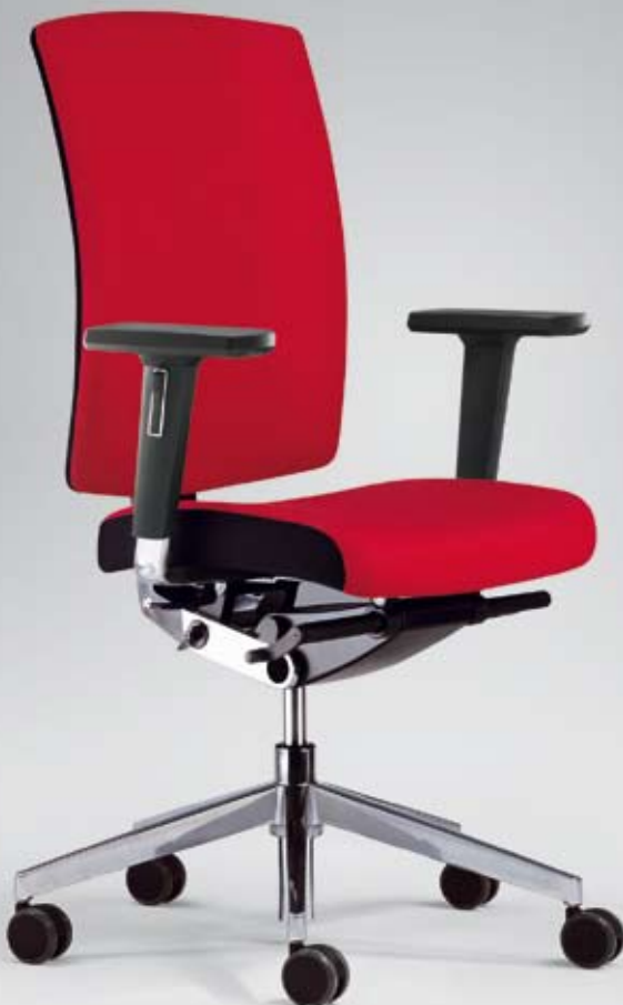
ES HW 16315 + Armlehnen/Armrests 397

Swivel chair with high, fully-upholstered backrest and multifunctional armrests (5 functions) with soft PU armpads.