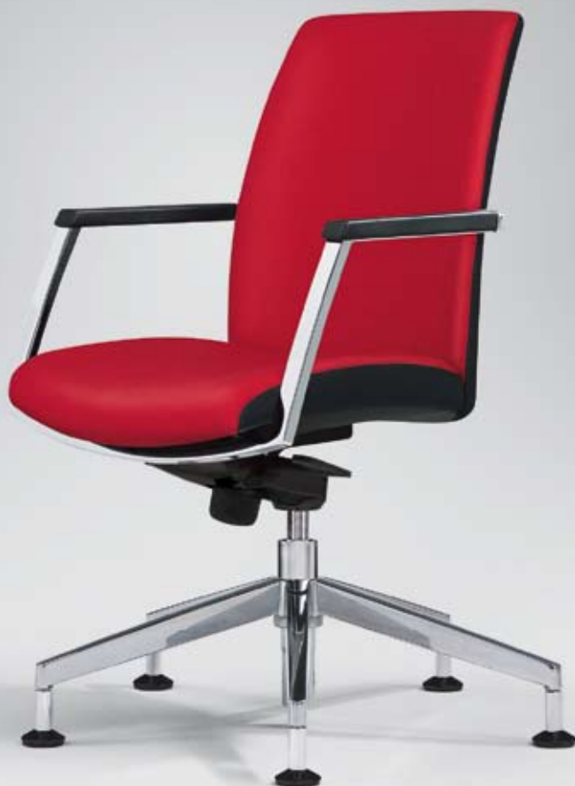
ER HW 16080 + Armauflagen/Armpads 002 Flexible Vollpolster Rückenlehne/ Flexible fully upholstered backrest

Fashions and opinions change, good design does not.