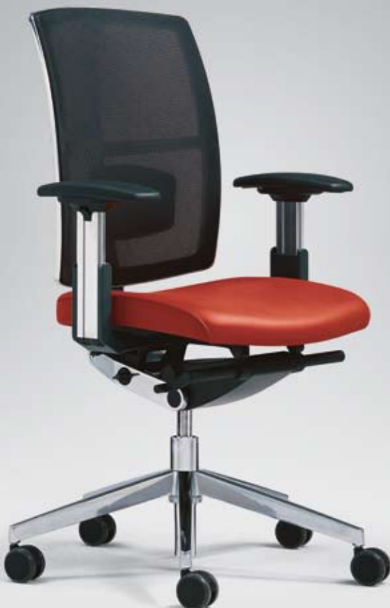
ES HW 16115 + Armlehnen/Armrests 315

Height-adjustable (10 cm) and depth-adjustable (2.5 cm) as standard.