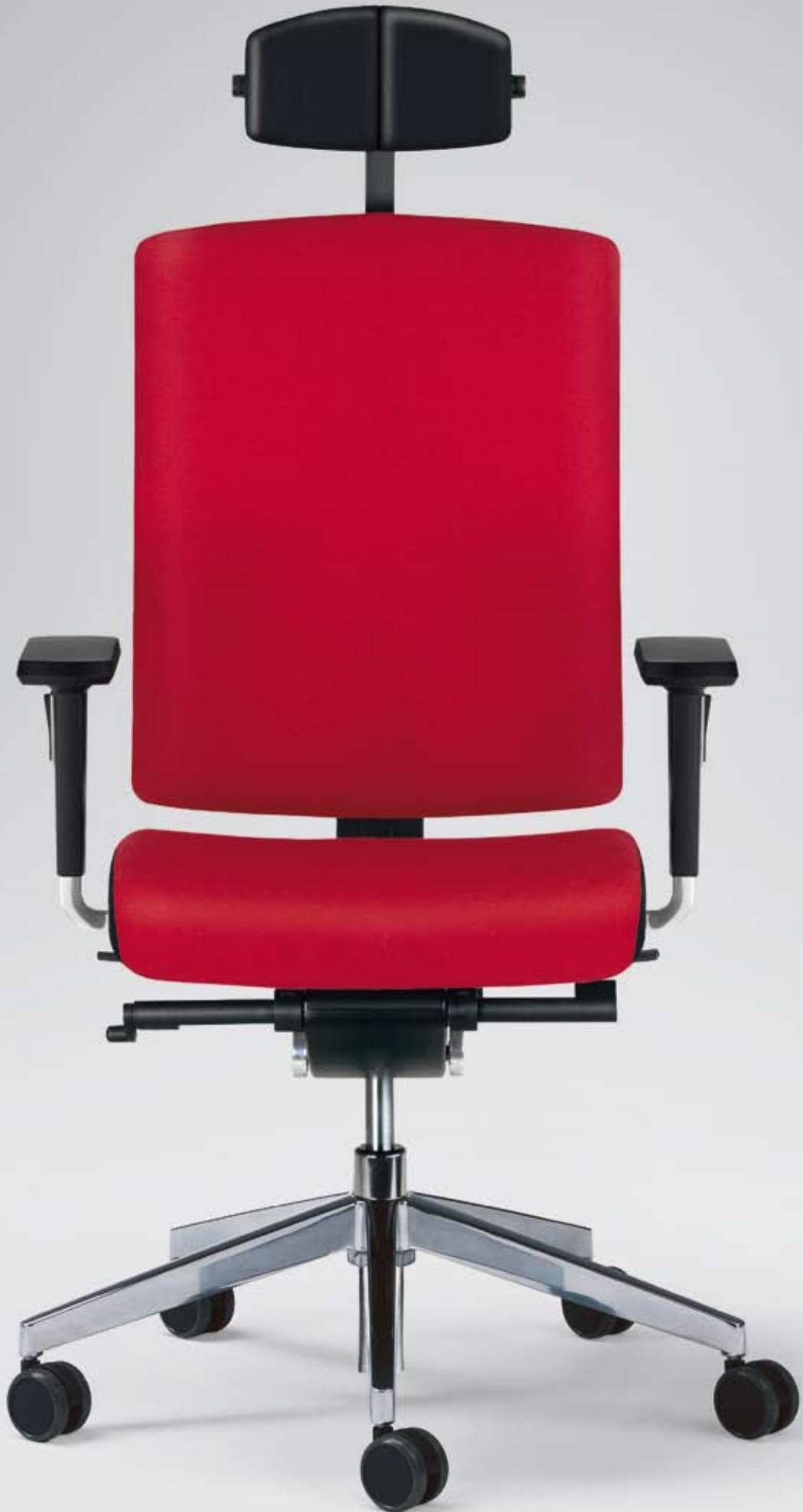
ES HW 16335 + Armlehnen/Armrests 397