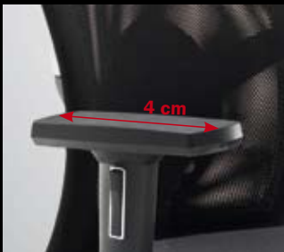
Armlehnen 295 (3F, PU)/ Armrests 295 (3F, PU)