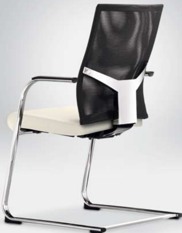
TA 17350 + Armauflagen/Armpads 001

Option: 4 cm höhen- und 1,5 cm tiefenverstellbare Lumbalstütze/ Option: Height-adjustable (4 cm) and depth-adjustable (1.5 cm) lumbar support.