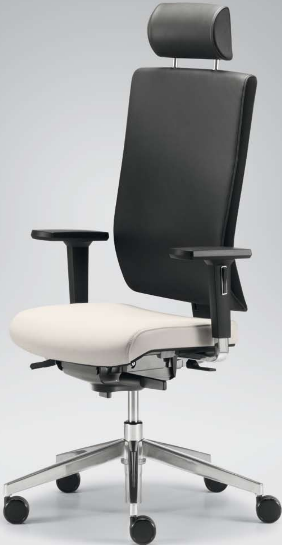
DB+ TA 18965 + Armlehnen/Armrests 195