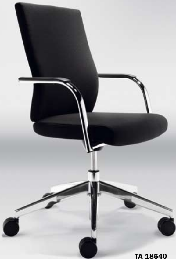
TA 18540 + Armauflagen/Armpads 001