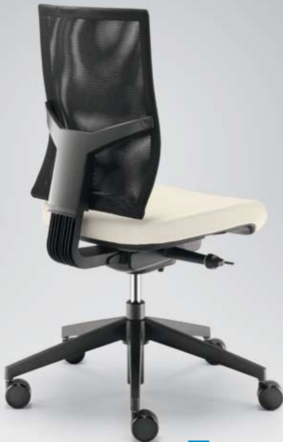
DB+ TA 17495