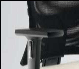
Armlehnen/ Armrests 122 (2F, PP)/ 123 (2F, PU)