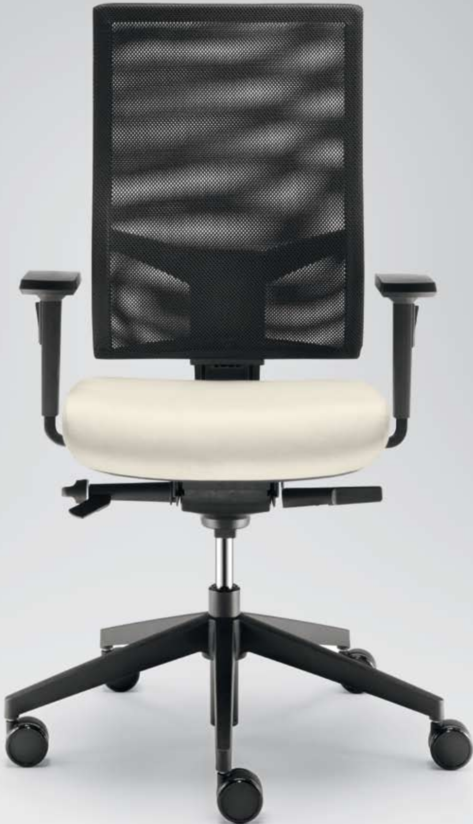
DB+ TA 17795 + Armlehnen/Armrests 125