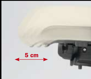
Option: Schiebesitz/ Option: Sliding seat