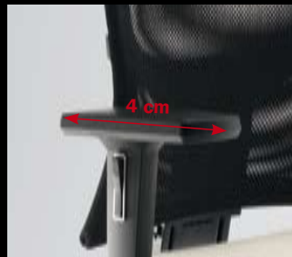
Armlehnen/ Armrests 125* (3F, PU)