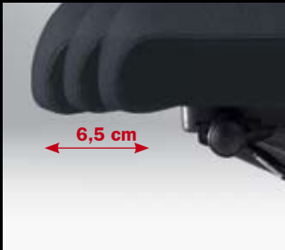
Option: Auto-Glide-System/ Option: Auto-Glide-System