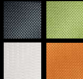
Textil-Rückenlehne/ Textile backrest

100% Polyamid/ Polyamide Strickgewebe/Knit fabric