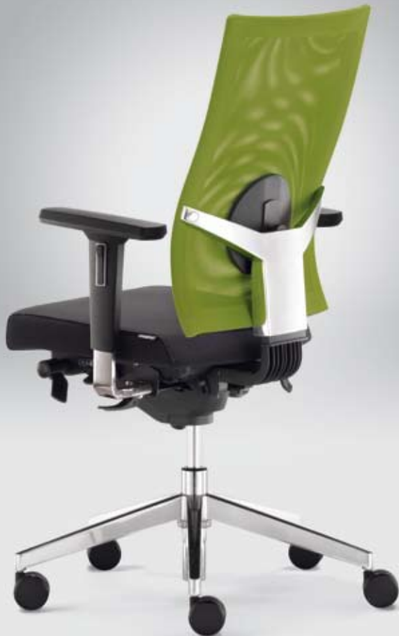
SD TA 17806 + Armlehnen/Armrests 295