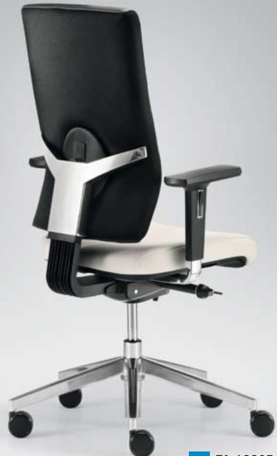
DB+ TA 18865 + Armlehnen/Armrests 195