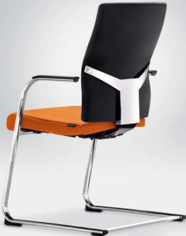
TA 18350 + Armauflagen/Armpads 001