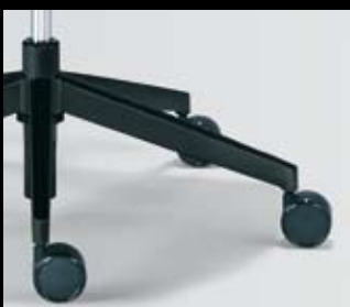
Fußkreuze/Bases Serie/Standard: Kunststoff-Fußkreuz, Typ E, schwarz/ Plastic base, type E, black