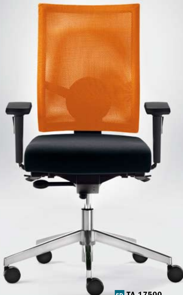
SD TA 17500 + Armlehnen/Armrests 295