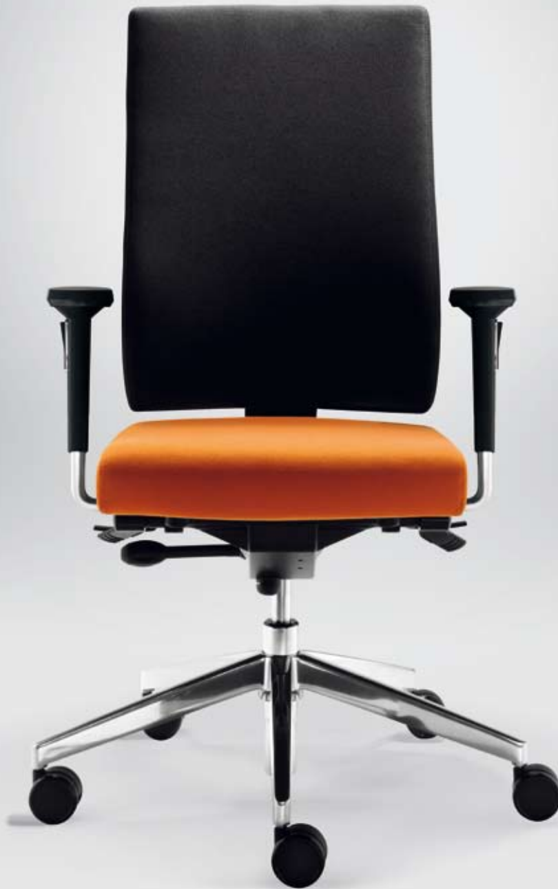
SD TA 18806 + Armlehnen/Armrests 295