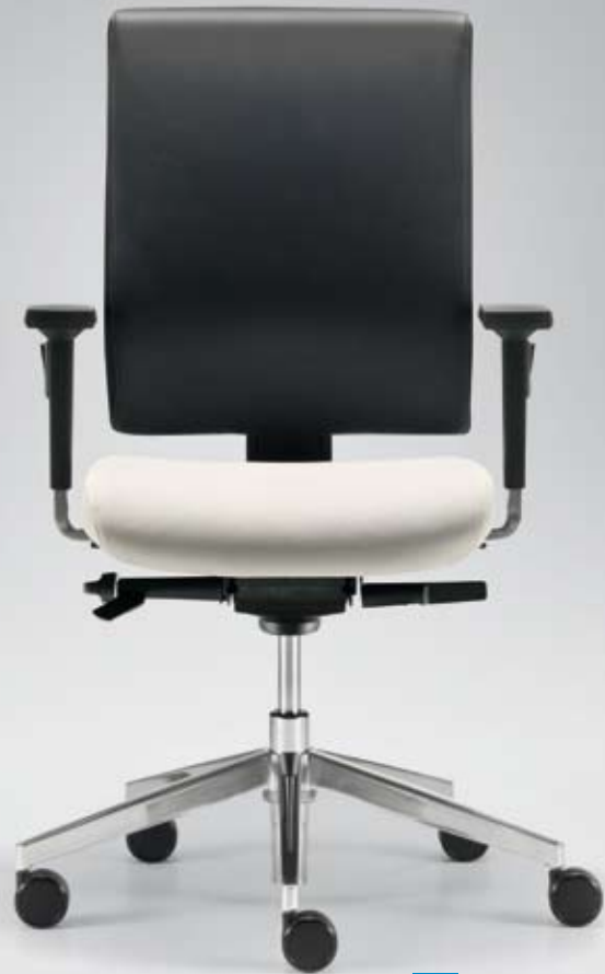
DB+ TA 18565 + Armlehnen/Armrests 195

Option: Height-adjustable (4 cm) and depth-adjustable (1.5 cm) lumbar support.