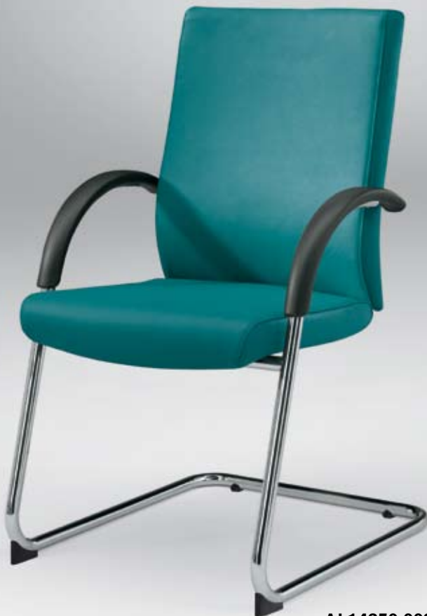
AJ 14350 003 (AJ 14350 000 = ohne Armlehnen/ without armrests)

Stackable four-legged chair with plastic outer shell and armrests with soft PU-arpads.