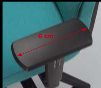
Armlehnen/ Armrests 125 (3F, PU)