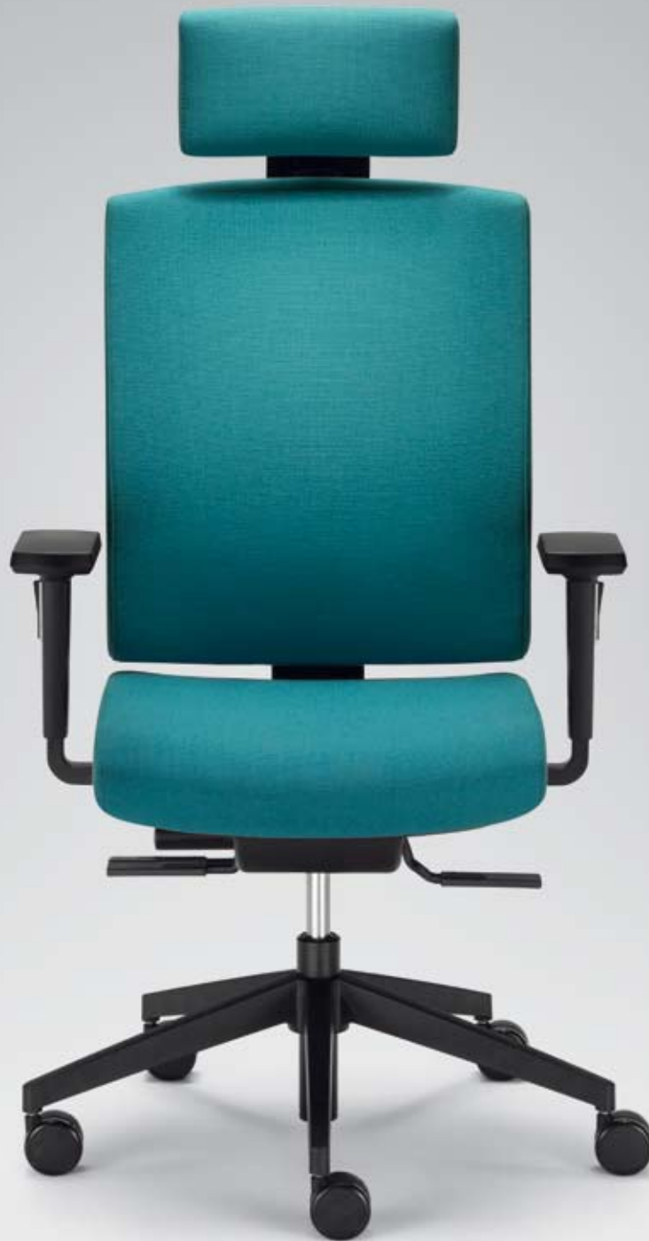
AB+ AJ 26585 + Armlehnen/Armrests 125