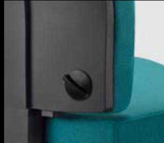
Option: Lumbalstütze/ Option: lumbar support