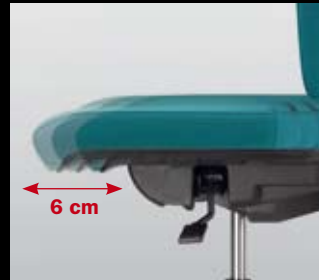
Option: Schiebesitz/ Option: sliding seat