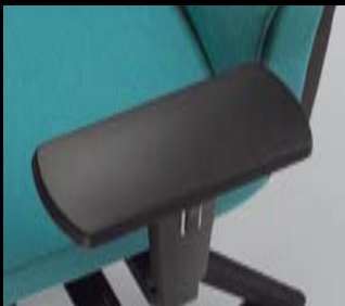
Armlehnen/ Armrests 122 (2F, PP)