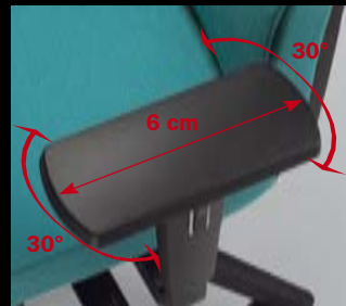
Armlehnen/ Armrests 127 (5F, PU)