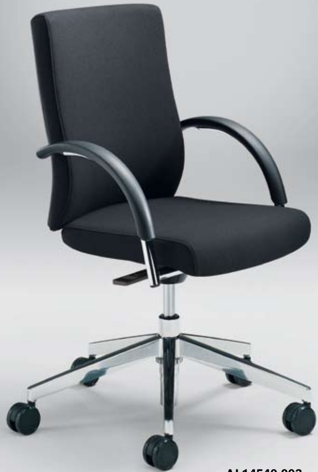
AJ 14540 003

Conference swivel chair with armrests and soft PU armpads.