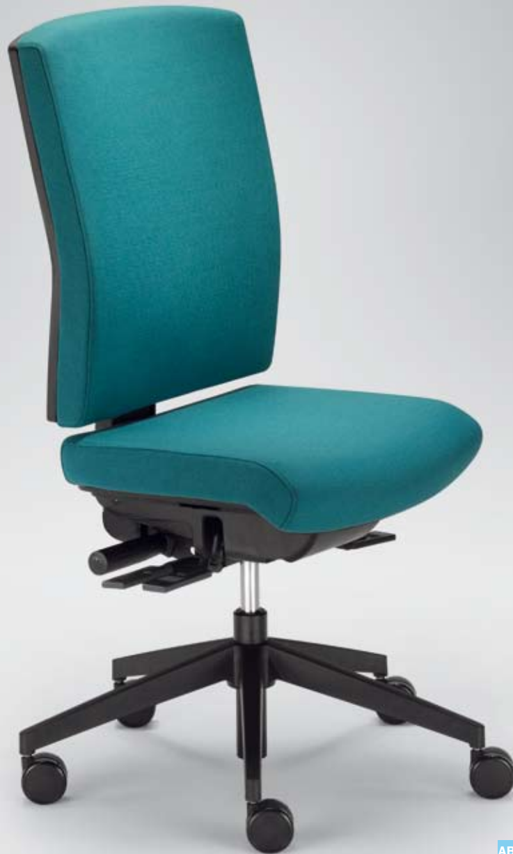
AB+ AJ 26285